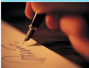
Тарих сәхифәләре (2 нче бит)