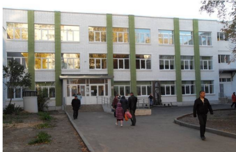
Мәктәп дәрҗясында... (2 нче бит)