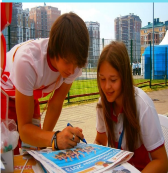
Сау бул, Универсиада – 2013! (3 нче бит)