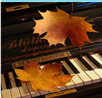
Илһам канатында (4 нче бит)